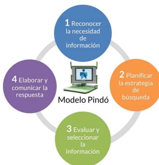
Figura 1. Etapas del proceso